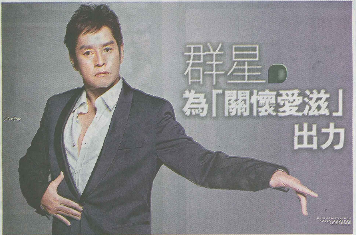
■阿倫笑面背後有嚴謹的態度。

Prestige Hong Kong創作總監Paris Libby與著名攝影師Olaf Mueller攜手，邀請本地及國際知名人士，有著名影星Sharon Stone及歌手Macy Gray，一同參與名為「WE UNITE」的攝影展，為「關懷愛滋」(AIDS Concern)籌募善款。攝影展由Mueller's OM Studio主理，作品於Prestige Hong Kong 12月號中刊出。當中部分照片由所屬名人親筆簽名，在Prestige Hong Kong於12月4日所舉行的Rouge派對中作慈善競投，收益全數捐贈「關懷愛滋」。